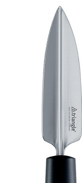
FRUCHTDEKORIERER fruit decorator 72 012 10