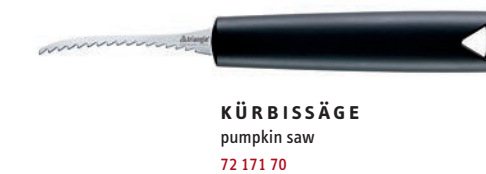
KÜRBISSÄGE pumpkin saw 72 171 70