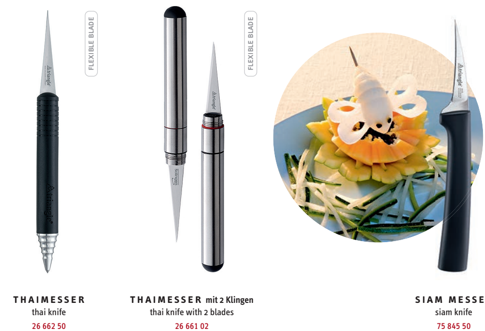
THAIMESSER thai knife 26 662 50