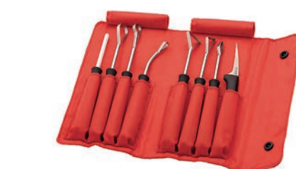
SCHLINGENMESSER-SET 8-teilig loop tool set, 8-piece 90 844 08 02