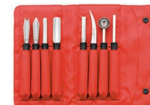
SCHNITZMESSER-SET „Professional“ 8-teilig carving tool set „Professional“ 8-piece · No. 90 818 08 02