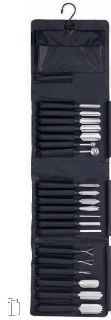
SCHNITZMESSER-SET „Artist“ 20-teilig carving tool set „Artist“, 20-piece 90 858 20 02