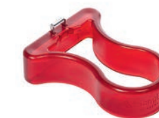
KÜRBIS SCHNITZER "U kurz" pumpkin carver „U short“ 50 174 08