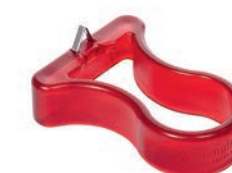
KÜRBIS SCHNITZER "V" pumpkin carver „V“ 50 173 12