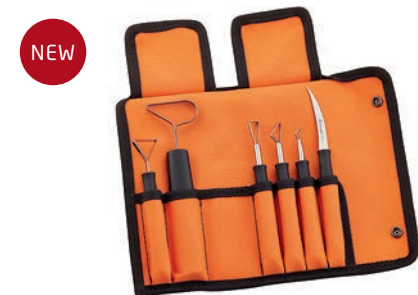
MODELLIER-SET „Villafane Studios“ 6-teilig sculpting set „Villafane Studios“, 6-piece 90 905 06 02