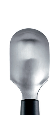
FRUCHTLÖFFEL fruit spoon 72 820 60