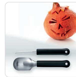
KÜRBIS-SCHNITZ-SET 2-teilig pumpkin carving set, 2-piece 90 185 02 10