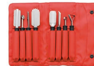
SCHNITZMESSER-SET „Special“ 8-teilig carving tool set „Special“ 8-piece · No. 90 831 08 02