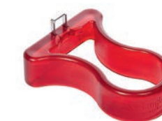
KÜRBIS SCHNITZER "U lang" pumpkin carver „U long“ 50 172 12