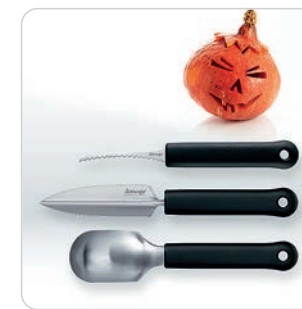
KÜRBIS-SCHNITZ-SET 3-teilig pumpkin carving set, 3-piece 90 835 03 02