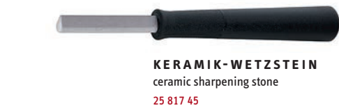
KERAMIK-WETZSTEIN ceramic sharpening stone 25 817 45