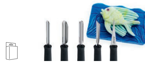
SEIFEN-SCHNITZSET 5-teilig soap carving set, 5 piece 90 837 05 02