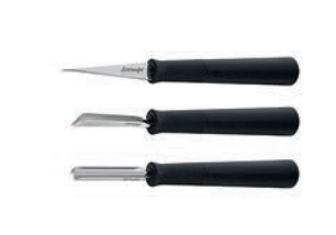
SCHNITZMESSER-SET „Basic“ 3-teilig carving tool set „Basic“ 3-piece · No. 90 857 03 02