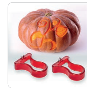
KÜRBIS-SCHNITZER-SET 2-teilig pumpkin carver set, 2-piece 90 176 02 10